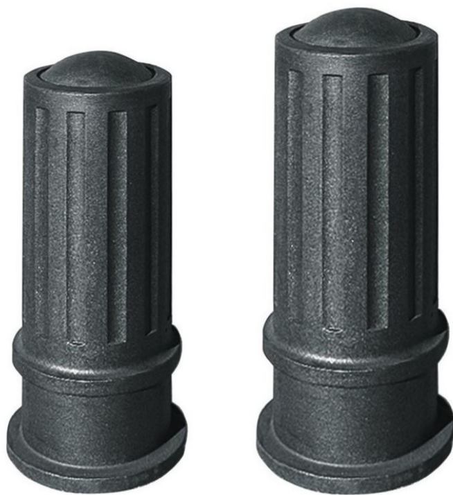
Opcional: Base para pila extraíble